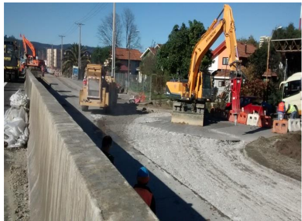
Trabajos Sector Terminal de Buses Collao, Dm. 72.000, Sector A