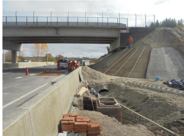
Estructura Paso Inferior Retorno Yumbel, Dm. 20.400, Sector A