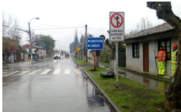
Desvíos por Caminos Interiores Cabrero – Monte Águila - Yumbel

En forma paralela a los desvíos de tránsito, la Sociedad Concesionaria implementó turnos de 24 horas para reforzar los movimientos de tierra y terminaciones faltantes en la nueva estructura del puente, de modo de habilitar el tránsito por ésta en un plazo estimado de 48 hrs, lo que finalmente generó que se habilitara el tránsito por la nueva estructura el día viernes 29 de mayo a las 23:45 hrs.