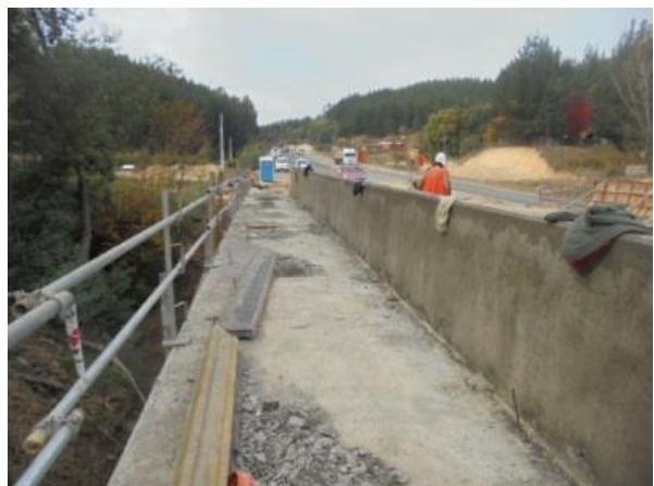
Ejecución Puente San Antonio, Dm. 55.500, Sector A