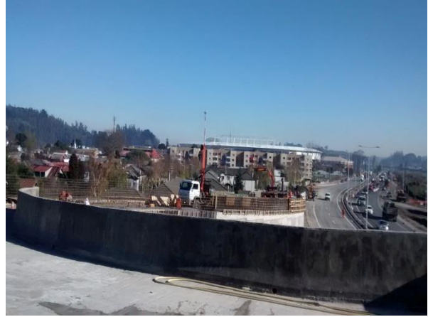
Enfierradura Defensas Tipo F, Paso Inferior Retorno Collao, Dm. 71.400, Sector A