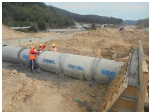
Ejecución Obra de Arte, Dm. 64.500, Sector A