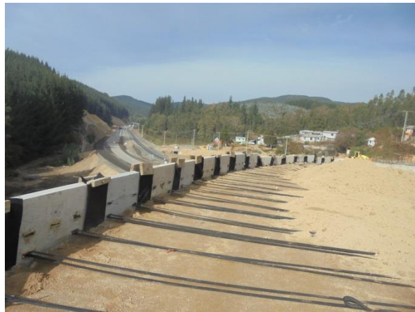
Muro TEM y Estructura Paso Inferior El Pino, Dm. 58.450, Sector A