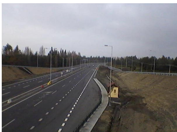
Enlace Retorno Cabrero, Dm. 11.100, Sector A