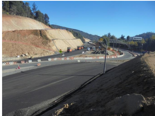
Colocación Pavimento Asfáltico Enlace Agua de la Gloria, Dm. 60.000, Sector A