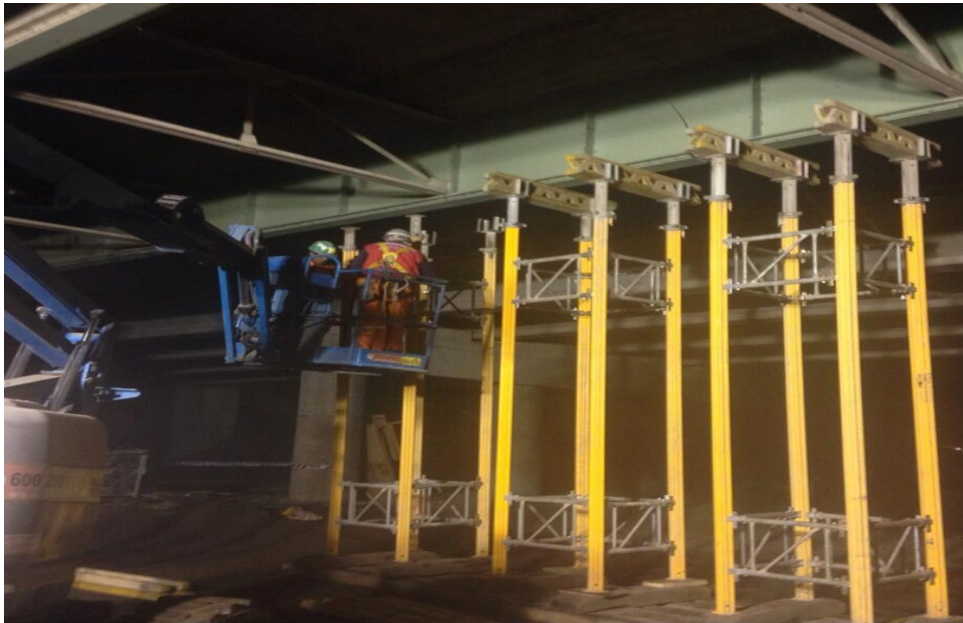
Apuntalamiento de Estructura Existente

Simultáneamente a los trabajos de terminaciones y habilitación de la nueva estructura del Puente Ibáñez se realizaron trabajos de apuntalamiento de la estructura dañada, con el objeto de evitar un posible colapso, mientras se realiza una evaluación y análisis por parte de los especialistas estructurales de la condición actual y futura del puente.