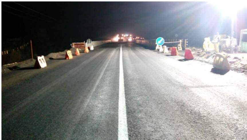
Trabajos de Habilitación Nueva Estructura Puente Ibáñez, Dm. 14.100, Calzada Sur

En forma paralela a los desvíos de tránsito, la Sociedad Concesionaria implementó turnos de 24 horas para reforzar los movimientos de tierra y terminaciones faltantes en la nueva estructura del puente, de modo de habilitar el tránsito por ésta en un plazo estimado de 48 hrs, lo que finalmente generó que se habilitara el tránsito por la nueva estructura el día viernes 29 de mayo a las 23:45 hrs.