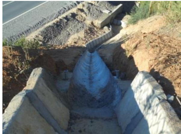
Obras de Saneamiento y Drenaje, Dm. 54.400, Sector A